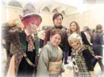
♪わたし達、キ・レ・イ?