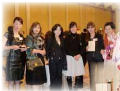
♪今年はうさぎ! 来年は変身できるかな!?

なお、今回も参加団体によるポスター、チラシの展示ブースも設けますので、ご希望の方はその旨併せてお知らせ下さい。来年こそは実り多き年になりますように、願って!