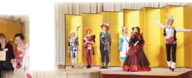
♪ハッピーニューイヤー! たのしいよ~!